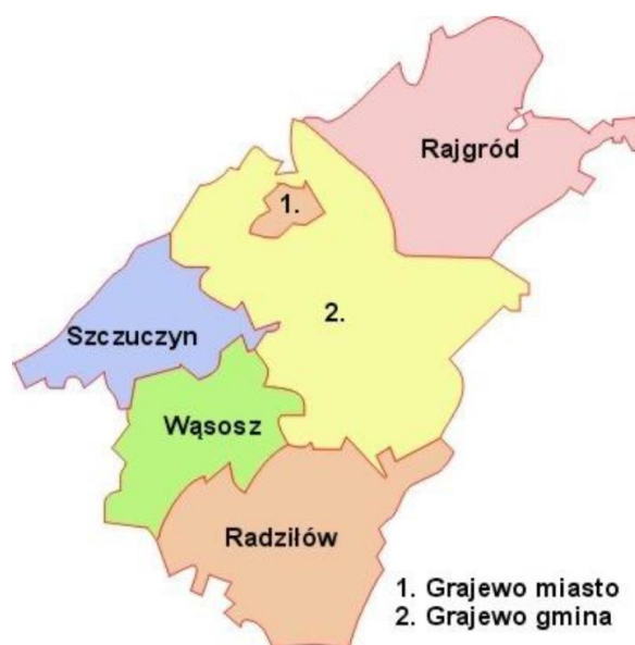
Rysunek 1 Granice administracyjne gminy Grajewo na tle powiatu grajewskiego.